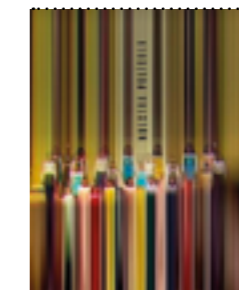
Referencia Nuestra Película Diana Bustamante. 2022

Archivos de la radio y tv nacional: noticias del Robo de las armas del Cantón Norte en 1978, suceso que toca mi vida directamente. O la declaración de guerra del presidente Turbay en 1979 contra el M- 19, consecuencia del robo de las armas y detonante del exilio de mi familia. Masacre del Salado, Toma del Palacio de Justicia, Armero, Imágenes de cine en blanco y negro de La marcha del silencio, campañas que hizo el M-19 en periódicos anunciando su llegada.