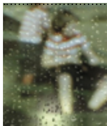
Referencia Heart of a Dog Laurie Anderson. 2015

Mi voz en off entabla un diálogo con las imágenes, es la palabra íntima que va articulando el documental y funciona como mis pensamientos, el discurso interno que nos acompaña siempre. Es una voz que cuenta, reflexiona y reacciona al material, como parte de un engranaje.