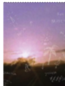
Referencia Viajo porque preciso, vuelvo porque te amo Karim Aïnouz y Marcelo Gomes. 2009

Este material es fundamental, es este registro que retomo para contar la película, es el mapa no solo geográfico, sino emocional por el que se mueve la historia, el paisaje por donde va transitando el duelo.