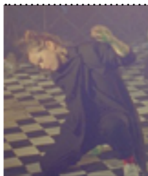
Referencia I hope i'm loud when i'm dead Beatrice Gibson. 2019

Para la puesta en escena de ficción voy a filmar algunas escenas que son recuerdos-imágenes que tengo de pequeña y me han acompañado siempre, no son una reconstrucción del recuerdo, son imágenes sensoriales, simbólicas, imágenes oníricas, que evocan un sentimiento, no están en la abstracción total, pero si son imágenes que construyen un recuerdo, como fantasmas que se desvanecen.