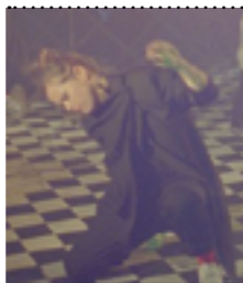
Referencia I hope i'm loud when i'm dead Beatrice Gibson. 2019

Para la puesta en escena de ficción voy a filmar algunas escenas que son recuerdos-imágenes que tengo de pequeña y me han acompañado siempre, no son una reconstrucción del recuerdo, son imágenes sensoriales, simbólicas, imágenes oníricas, que evocan un sentimiento, no están en la abstracción total, pero si son imágenes que construyen un recuerdo, como fantasmas que se desvanecen.