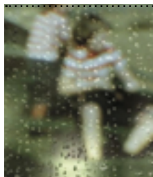
Referencia Heart of a Dog Laurie Anderson. 2015

Mi voz en off entabla un diálogo con las imágenes, es la palabra íntima que va articulando el documental y funciona como mis pensamientos, el discurso interno que nos acompaña siempre. Es una voz que cuenta, reflexiona y reacciona al material, como parte de un engranaje.