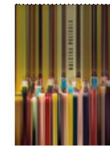
Referencia Nuestra Película Diana Bustamante. 2022

Archivos de la radio y tv nacional: noticias del Robo de las armas del Cantón Norte en 1978, suceso que toca mi vida directamente. O la declaración de guerra del presidente Turbay en 1979 contra el M- 19, consecuencia del robo de las armas y detonante del exilio de mi familia. Masacre del Salado, Toma del Palacio de Justicia, Armero, Imágenes de cine en blanco y negro de La marcha del silencio, campañas que hizo el M-19 en periódicos anunciando su llegada.