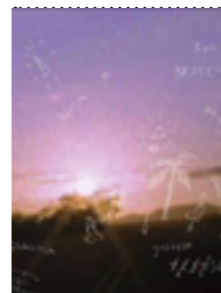
Referencia Viajo porque preciso, vuelvo porque te amo Karim Aïnouz y Marcelo Gomes. 2009

Este material es fundamental, es este registro que retomo para contar la película, es el mapa no solo geográfico, sino emocional por el que se mueve la historia, el paisaje por donde va transitando el duelo.